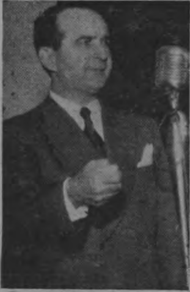
Presidente JOSE FIGUERES ...una doctrina...

Las instituciones humanas necesitan un continuo reanálisis, una continua evolución. Empeñarse en que tal o cual cosa es definitivamente buena o definitivamente mala es un grave error.